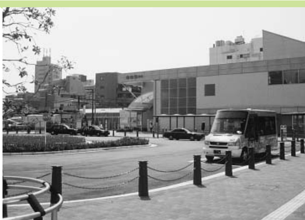
完成した保谷駅北口前広場

市では、平成7年度から保谷駅北口周辺の整備を実施してきました。このたび駅前広場が完成し、市民の皆さんにご利用いただけるようになりました。これにあわせて、はなバス第1ルートも、駅乗り入れを開始しています。