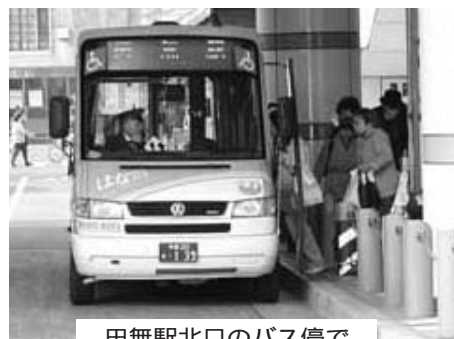
田無駅北口のバス停で