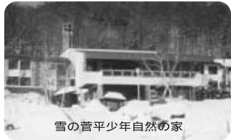
雪の菅平少年自然の家

周辺ガイド 車で30分くらい のところに温泉 プール付き町営 温泉など、心身 のリフレッシュ に最適な気軽 に入れる温泉があります。 菅平スキー場情報 スキー子どもの日として毎月第3日曜日は、小学生以下のリフト代が無料です。 菅平少年自然の家(☎0268・74・277)