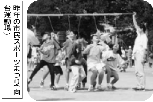
昨年(2001年)の市民スポーツまつり(向台運動場)

とき 10月14日(体育の日)午前9時20分〜午後4時 ところ 向台運動場・公園グラウンド(向台町五丁目) 田無駅 から徒歩約20分です。 交通機関 当日運行する市民送迎バスをご利用ください。 ルート 保谷庁舎〜田無庁舎〜向台運動場(会場)。このルートを1本のバスが往復