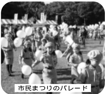
市民まつりのパレード

募集内容 パレード、物品の販売、各種野外演芸、各種相談、子どもコーナー等、市民まつりの趣旨になじむもの(応募者が多数の場合は選考となる場合があります)。