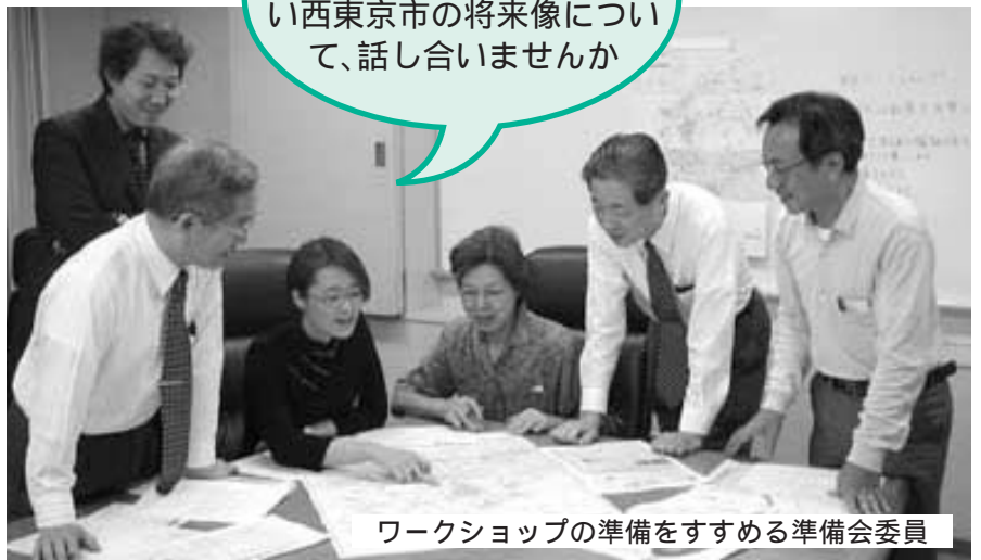
ワークショップの準備をすすめる準備会委員

身近なことについて、そして、あなたが描く新しい西東京市の将来像について、話し合いませんか