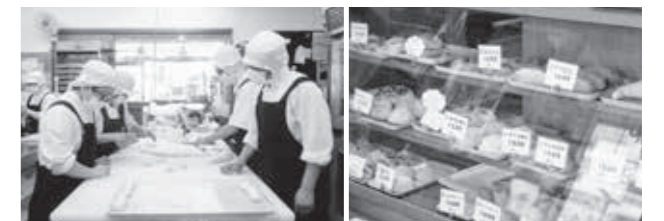
▲「石窯パン工房ウーノ」で働くスタッフと美味しそうなパンの数々

2022年1月、ウーノの会はさらに地域福祉に貢献すべく、西東京市より認可を受け「社会福祉法人ウーノ」へと法人格を移行。目下の目標は高等部を卒業した青年の余暇活動の場を立ち上げることです。障害の有無に関わらず、誰もが生きやすいノーマライゼーション社会を目指し、今後も仲間たちと活動していきたいと思えます。