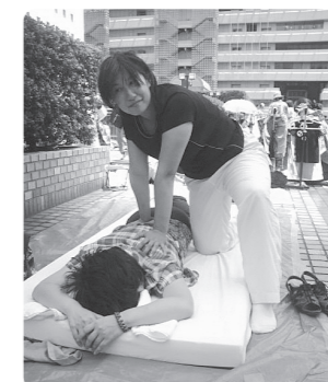
▲フリーマーケットでの体験施術会の様子

「美腰快活クラブ」としては、男女が平等であるためにも、そして何事に於いても、まずは心身ともに健康でないとどんな活動も出来ないと考えており、「一日一笑」をテーマに、講座と銘打っていますが、時にはお話しするだけ、時にはしっかりと健康の事を伝えさせて頂くように活動カラーを普段とは変えて行っております。