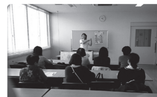
▲パリテまつり健康講座

講座の際は、ぜひ一度お気軽に足をお運びください。心と身体は密接です。どちらかの健康状態が失われると、たちまち辛くなります。元の気を取り戻すきっかけとして、まずは一緒に笑って、そして「元氣」に活発に、自分らしさを発揮できるようにこのサークルをぜひ活用してください。