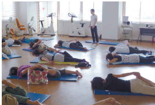
気功・整体&コミュニケーション講座 (9月5日)