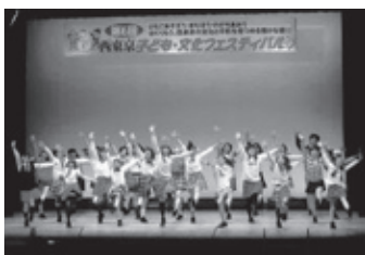
▲今年1月21日に行われた西東京子ども・文化フェスティバルにおけるダンスチームによる舞台

昭和60年ごろには保谷市、田無市各々で「子どもまつり」を毎年行っていました。保谷市は小学校の校庭・体育館で開催地(小学校)を毎年変えて春に実施し、田無市は市民会館で秋に実施していました。合併後「西東京子ども・文化フェスティバル」と名称を変更し、毎年1月の日曜日に市民会館で行い、今年度で17回目を迎えます。