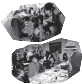
▲手づくりコーナーではブーメランを作って飛ばしました