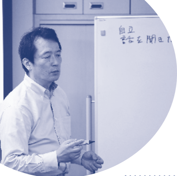
自立 女性を助ける

以上のように、これから女性が自立し、活躍の場を探そうとするなら、「不」を駆使しながら、「目下の不」を解決すべく、「ダイバーシティ」の視点に立つことが大切だと言えよう。従来のステレオタイプの発想にこだわらない、女性ならではの柔軟な感性や目線こそが豊かな社会を創るのに必要であると、世界も気づき始めたのではないだろうか。