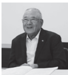
▲残業しているスタッフを見つけると「早く帰りなさい」と声をかける阿さん

私は、保育園や介護施設などを経営しているので、保育士・介護士・看護師など女性の職員が多い職場にあります。職員の方に長く勤めてもらうためにも、各事業で産前産後休業、育児休業、介護休業などの制度を早くから取り入れており、最近は男性職員も利用しています。