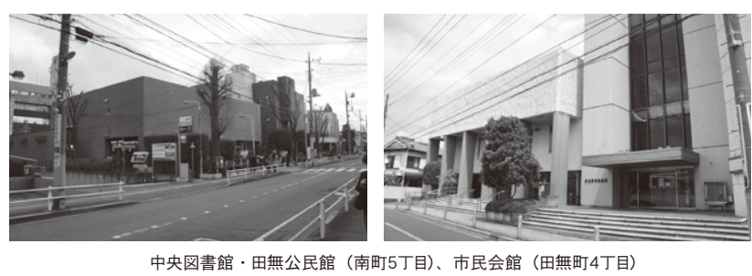
中央図書館・田無公民館 (南町5丁目)、市民会館 (田無町4丁目)

【市長】本市の財政状況は次第に厳しさを増しており、近年では特に硬直化が進んでいると認識している。ほかの団体がおおむね改善傾向にある中で本市の財政の硬直化が進んだことは、普通交付税の段階的な縮減や公債費の増加など、合併市特有の要因が大きい。