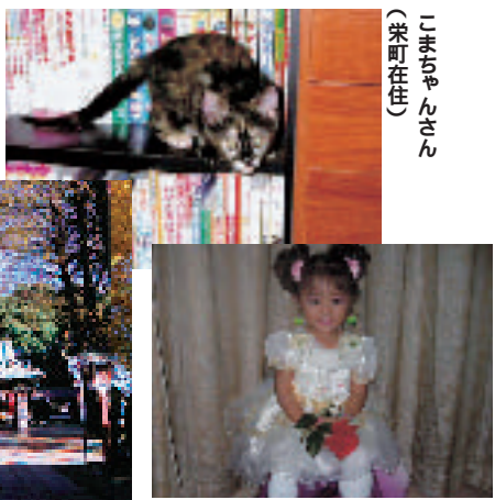
こまちゃんさん (米町在住)

本号には掲載写真募集にご応募いただいた市民の方の写真を1面ほかに掲載させていただきました。ご応募まことにありがとうございました。