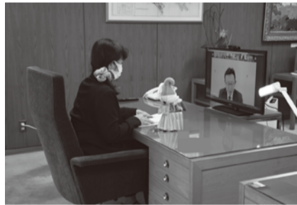
関東市議会議長会オンライン会議