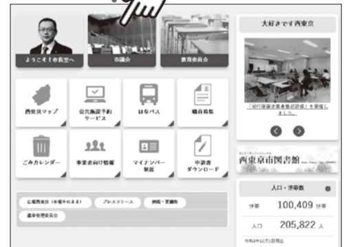
西東京市ホームページトップ