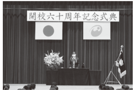
ひばりが丘中学校開校60周年記念式典

今後も、新型コロナウイルス感染症対策を行いつつ、議事機関としての責務を果たします。