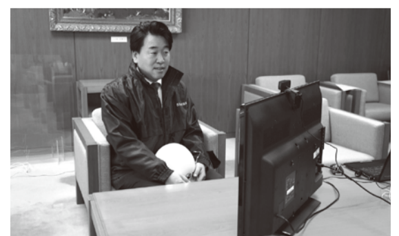
議会防災訓練 オンライン会議システムを使用している様子(令和6年1月25日)