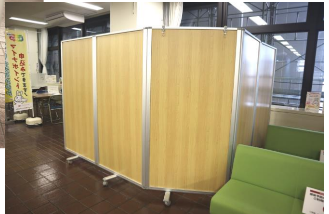
おくやみ窓口の様子