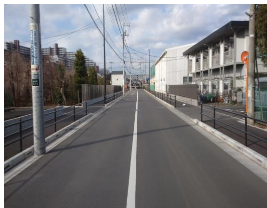
市道 118 号線の整備状況