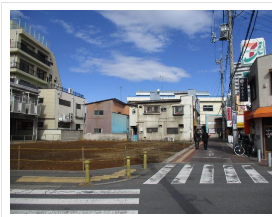
田無駅南口の状況