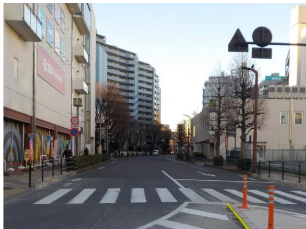
市道 104 号線の現況