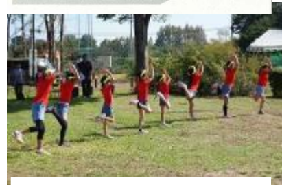
【したのや縄文体操】