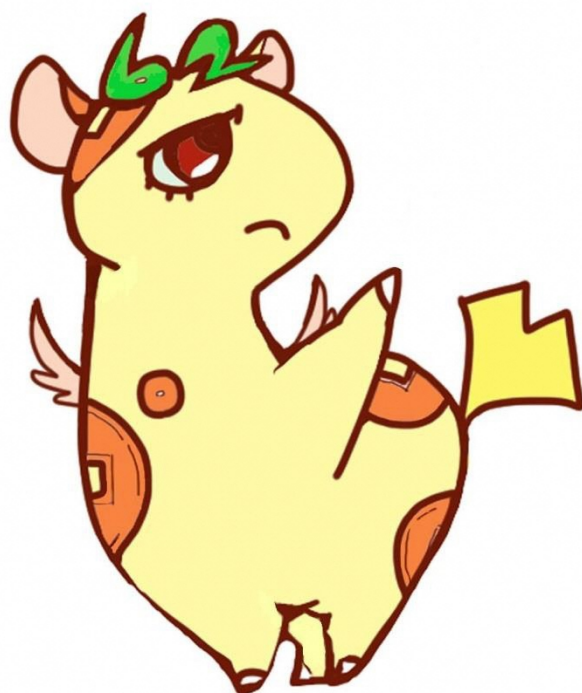
個人住民税PRキャラクター 「ぜいきりん」

東京都と都内全 62 区市町村は、 平成 29 年度から個人住民税の 給与からの特別徴収を徹底します。