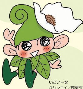
いこいな ©シンエイ / 西東京市