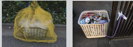
防止强风散射的措施示例