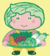
西東京市 農産物キャラクター 「めぐみちゃん」