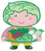
西東京市農産物キャラクター「めぐみちゃん」