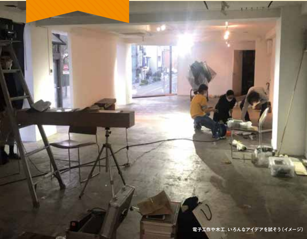
電子工作や木工、いろんなアイデアを試そう(イメージ)

ティンカーは修理屋さん。ティンカリングってなんでもいじり回してみる。電子工作と編み物、木工は同じ?違う?転がっている木っ端、電線、壊れた電池ボックス、リボン、植物の糸。動かせるかな、音は出るかな、光るかな、縫えるかな?こわして作って、まずはやってみよう!