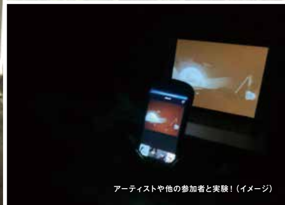
アーティストや他の参加者と実験!(イメージ)