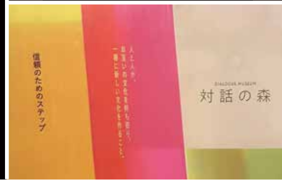
“純度100%の暗闇”の中で感じてみよう