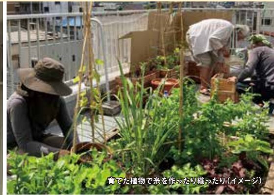
育てた植物で糸を作ったり織ったり(イメージ)