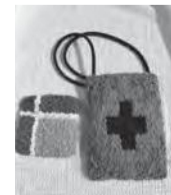
コースター(左) ポシェット(右)