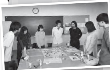
制作メンバーの声は4面へ!