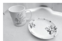
作品のサイズ マグカップ (高さ9cm、直径8.5cm) プレート(直径15cm)