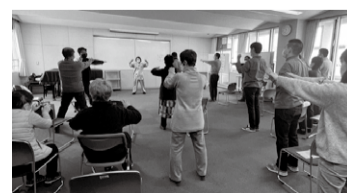
あめんぼ青年教室中国体操