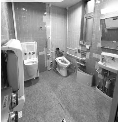
▲1Fだれでもトイレ。ウォシュレット、おむつ替え用の台、オストメイト専用流し台を設置しました。