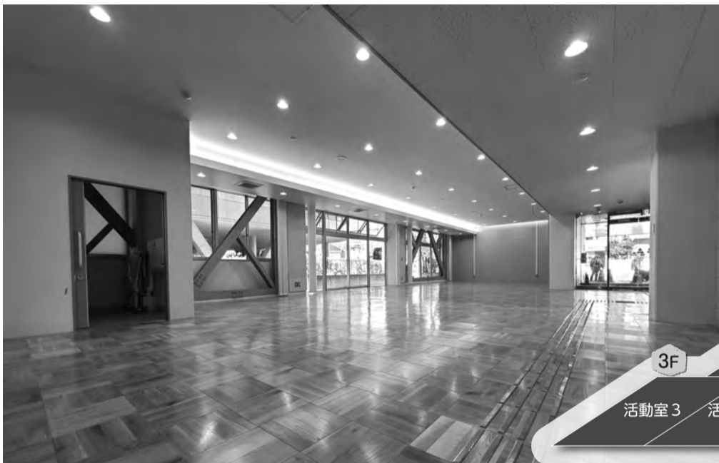
▲1Fロビー。フリーWi-Fiを整備し、写真奥のエリアは学習コーナーとなりました。全館LED照明となり、環境に配慮しながら明るく快適な空間になりました。またピクチャーレールを設置し展示の利便性が向上しました。

田無公民館は4月1日(金)午前9時に再開します。今回の改修工事では、耐震補強等による施設の安全性確保に加え、施設内のレイアウト変更や設備の更新を行いました。ご利用いただける部屋が1つ増え、実習室の調理台、ガス台、オーブンを更新するなど、より快適にご利用いただけるようになりました。また、授乳室の新設、誰でもトイレの更新など、子育て中の方や障がいのある方をはじめ、どなたにもより安心してご利用いただけるようになりました。生まれ変わった田無公民館にぜひお越しください!