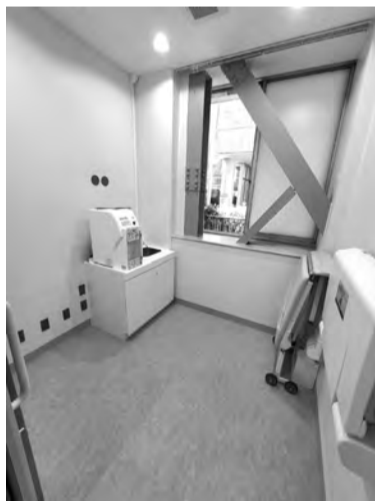
▲1F授乳室。乳幼児連れの方にも安心してご利用いただけるよう、調乳専用の浄水給湯器、おむつ替え用の台、簡易ベッドを設置しました。