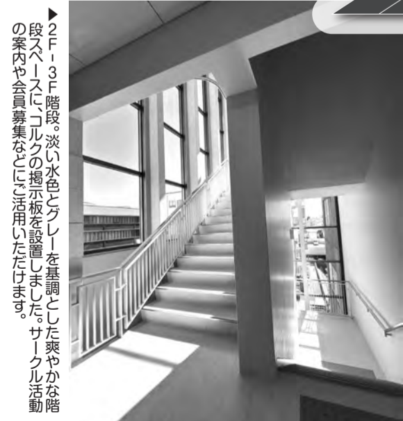
▲2F-3F階段。淡い水色とグレーを基調とした爽やかな階段スペースに、コルクの掲示板を設置しました。サークル活動の案内や会員募集などに活用いただけます。