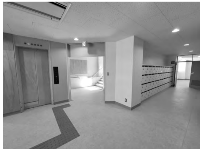
▲2Fエレベーターホール。団体連絡箱を、こちらと地下階に移設しました。団体連絡箱は94箱(2Fに56箱、B1Fに38箱)設置しています。

声の「公民館だより」をお届けしています。知り合いで希望される方がいらっしゃいましたら、谷戸図書館(電話042-421-4545)へお問い合わせください。