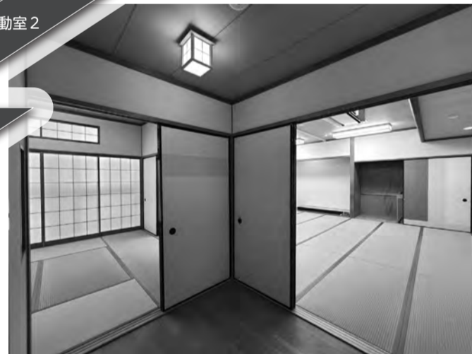
▲2F和室。照明がLEDになり、畳が新しくなりました。茶道、華道、舞踊、健康体操、ヨガ、乳幼児親子の集まりなどにご利用いただけます。