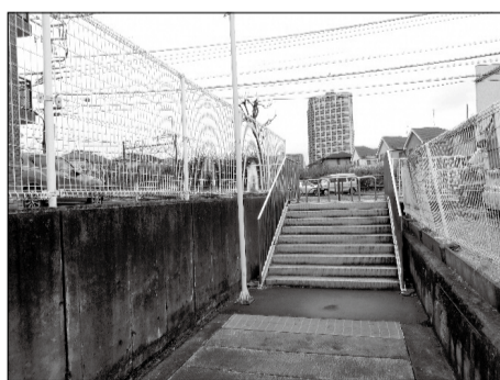
白子川の始まりとひばりヶ丘駅前のタワーマンション