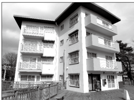
ひばりが丘団地メモリアルの旧74号棟跡

今は谷戸小・谷戸第二小を中心に、4つの緑のある場所(せせらぎ公園・発想の森・西東京いこいの森公園・東大農場)が広がっています。