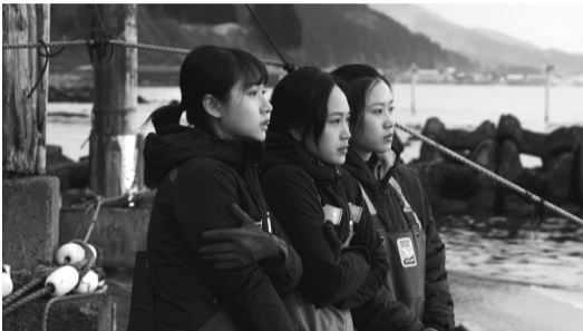
(監督:藤元明緒/2020年/88分) ©2020 E.x.NK.K./ever rolling films