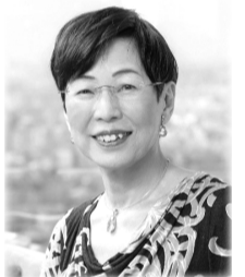
上野千鶴子氏