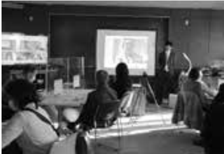
福岡の被災地支援者(中央画面)とつなぎ、講師とクロストーク。左の画面はオンライン参加者

新型コロナウイルスの感染拡大が始まって早2年の月日が過ぎようとしています。公民館は昨年3月から5月の臨時休館を経て、制限付きで再開、その後も緊急事態宣言の発令に合わせて条件を変えながら運営をしてきました。試行錯誤の中、学びや活動を止めないための方策として、オンラインを取り入れた事業運営に取り組んできました。今回はその一部についてご紹介します。