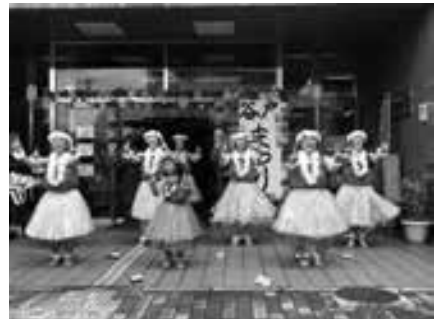
第31回谷戸まつり(平成31年)オープニングの様子

時 ①12月4日 ②1月8日 ③2月5日 ④3月5日 ⑤3月19日 ⑥4月2日 土曜日 10時~ 場 谷戸公民館