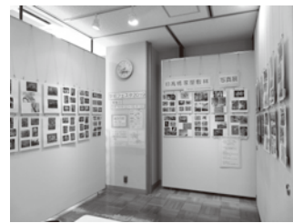
▲駅前フェスタ2019 展示の様子