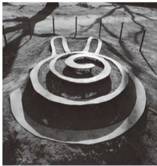
②「グー・チョコキ・バー」/ステンレススチール、土、タマリユウ/長澤伸穂(のぶほ) 世界各地で使われている子どもの遊びを表現。コミュニケーションが渦を巻いて広がることを願う。