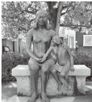
①「母子像」/ブロンズ、御影石、花こう岩/細井良雄 母子のふれあいと穏やかな表情を通して、平和の大切さを訴える。