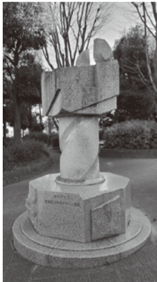
④「廻り岩」/不明/半田富久 太古より人々が抱えてきた「神の力が巨石を動かす」という思いを作品に託し、地域を見守る象徴とした。

わが街をもっと知りたくて ちよごと彫刻さんぽ 第2回 文理台公園・谷戸イチョウ公園 市内にある野外彫刻を編集室が取材紹介する「彫刻さんぽ」。第2回は文理台公園と谷戸イチョウ公園です。それぞれ三つの彫刻があり、きっと知らなかった作品に出会えるでしょう。 文理台公園(東町1-4)の入口広場に建つ①「母子像」。1984年の開園以来、母子の笑顔が来園者を優しく迎えます。右手奥の緑地に進むと、盛り上がった地面にじゃんけんの手の形を表現した②「グー・チョコキ・バー」を発見！子どもが自由に遊ぶことを目的に作られた作品ですが、楽しさ満載で大人も童心に返って遊びたくなります。中央のグラウンドの北、ポンプ場に続く丘陵に広がるのは③「East Asian Time Terrace(イースト・エイジアン・タイム・テラス)」。文理台公園の広さや地形を生かしたスケールの大きな作品です。 一方、谷戸イチョウ公園(谷戸町2-12)の開園当初(1987年)からあるのは④「廻り岩」。石に地域を守る願いを託しました。公園のシンボルとして親しまれているのが、西側にある高さ6mの石のモニュメント。⑤「桌の化石」と名付けられたこの作品は、作者いわく「数万年後に20世紀の化石の一つとして出土する」と壮大なロマンを秘め、見る者の想像力をかき