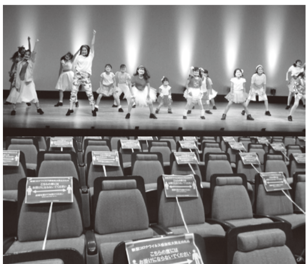
権藤さんが担当する「子ども文化芸術フェア～あっとアート体験!!」は、さまざまな団体がワークショップや発表を行うイベント。残念ながら昨年は中止となったが、子どもたちは無観客のこもれびホールでパフォーマンスを行った。

東京市文化芸術振興会」です。会員は音楽、美術、舞踊、古典芸能から、映像、デザイナー、まちづくり関連など多岐にわたり、延べ80を超える個人や団体で構成されています。近年は主な事業として、①子ども文化芸術フェア、②田無駅北口のペDESTリアンデッキライブ、③フオートコンテスト・展示会・写真集作成を行う「西東京百姿」を実施していましたが、昨年はどれも中止や規模の縮小を余儀なくされました。