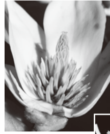
写真① ハクモクレン

まず花の色・形など、昆虫との関係です。年明け後、ロウバイ、マンサクに続き、トサミズキ、キブシ、サンシュユなど早春には黄色い花が多く 30~40%を占めている感じがです。色彩の少ないこの時期、澄んだ青空に補色の黄色は非常に目立つ色で、いち早く活動するアブ、ハエ、ハチ類に花粉を運んでもらう戦略のように感じられます。形も、ミズキやヤブガラシのように上向きに咲く小さな花の集まりであればどんな昆虫でも蜜が吸え、その代償として花粉を運んでもらえます。しかし下を向いた壺形のアセビやドウダンツツジなどであればハナバチ類しか潜れ