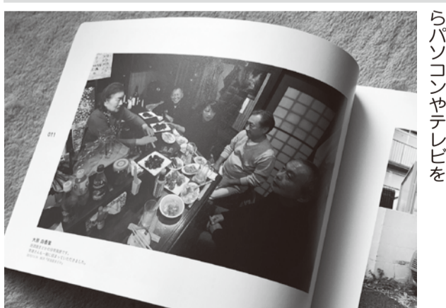
濱口さんが手がけるプロ・アマ問わずのフォトコンテスト&展示会「西東京百姿」。これは選出作品を掲載した写真集の1ページ。「百景」ではなく「百姿」という言葉に、人や地域の文化を記録しようという思いが込められている。