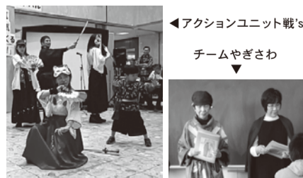
アクションユニット戦's チームやぎさわ