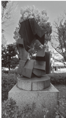
⑥「AS(アズ)」/コールテン鋼ステインブラック処理/松本憲宜(のりよし) 直線と曲線、安定と不安定な形態から、生命が持つ変化に満ちた時の流れを表現。