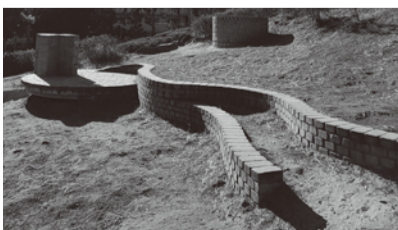
③「East Asian Time Terrace(イースト・エイジアン・タイム・テラス)」/レンガ、ブロンズ、竹/アズビー・ブラウン 江戸時代に輸入されたという半球型の日時計から発想を得て、丘陵に時を刻むテラスを創出。