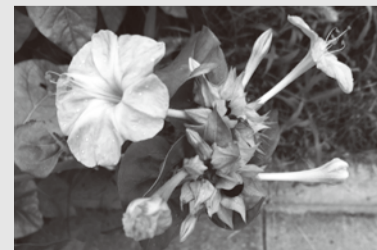
文・写真 大森拓郎(新町在住)

真夏になると一夜花が増えます。カラスウリ、マツヨイグサ、オシロイバナなどです。何時頃咲いて何時頃閉じるのか、お子さんたちと観察してはいかがでしょうか。オシロイバナは別名ユウゲショウ(夕化粧)のほか、英語ではFour o'clockと呼ばれています。本当に夕方4時頃に咲くのでしょうか。花の色は、赤、白、橙、黄など多彩で、花の形がユニークです。筒状の花は、花弁でなく萼が変化したもので、皺のある黒い果実を割ると真っ白い粉状の胚乳が詰まっています。これを白粉代わりに用いたことからその名がつけました。南アメリカ原産で、江戸初期に鑑賞用として渡来しました。