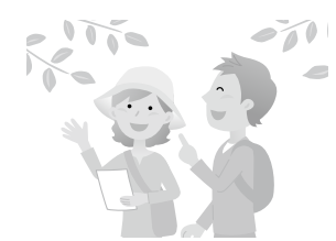
旧高橋家屋敷林「野草園」 毎週金曜日10時～12時開放 季節ごとに移り変わる野草が楽しめます。

西東京市の自然を維持するために私たちができることを考える今回の講座では、まず、限られた範囲ではありますが、地域の貴重な緑地である旧高橋家屋敷林と碧山森に実際に足を運んで観察しました。また、自然の草木を使った寄せ植えや、染め物、スケッチにも挑戦しました。 参加者は28人。中には、「花の会」「自然を見つめる会」「木の子会」「東久留米の水と景観を守る会」「高橋家屋敷林保存会」等の団体で、すでに地域の自然保護に貢献する活動をしている方もいました。 さらに、12月5日(木)は、講座を振り返る意見交換会を開催しました。 参加者の声を紹介し ・保谷の自然を見つめ活かした講座は興味深いものでした。 ・もっと深く楽しみたいです。 ・植物の観察はよくしていても描くと細かい部分を見落とす