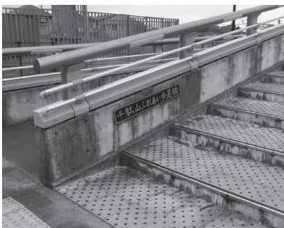
千駄山ふれあい歩道橋