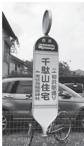
千駄山住宅(バス停)

馬の背に積む薪(一頭一駄)が千駄もとれたといわれる雑木林があったので、千駄山と呼ばれていました。