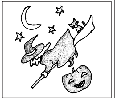
※タッチの違いや色の濃淡は間違いに含みません。 出典:「記念日・祝日の辞典」加藤勉男著 東京堂出版

記念日にちなんでまちがさがし絵をお楽しみください。まちがさがしは、解答は2面です。