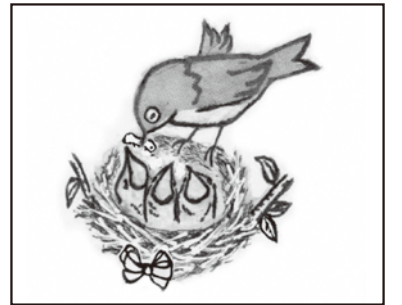
※タッチの違いや色の濃淡は間違いに含みません。