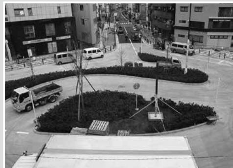
現在のひばりヶ丘駅北口