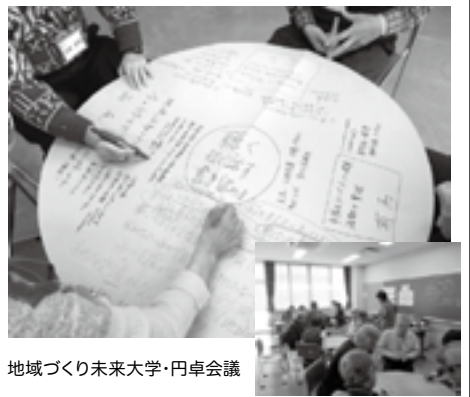
地域づくり未来大学・円卓会議

現在、今年度の開講に向けて準備を進めています。詳細については、6月以降に発行する公民館だよりでご案内します。