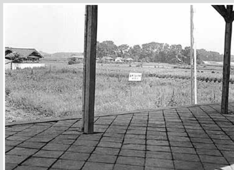
西武池袋線ひばりヶ丘駅ホームからの北側の風景 昭和35(1960)年撮影 西東京市中央図書館地域・行政資料室所蔵