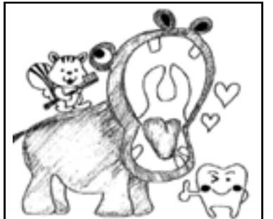
※タッチの違いや色の濃淡はまがしがしに含みません。