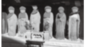
被爆した六地藏(宝樹院 六地藏菩薩立像)