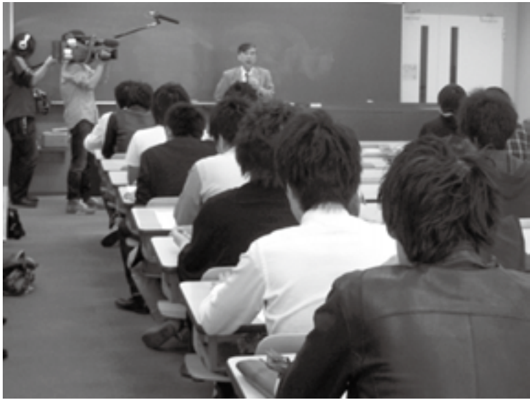
明治大学の労働講座 過労死をテーマにした講座は テレビ番組にも取りあげられた

谷戸公民館 谷戸町1-17-2 ☎042-421-3855 yato-kou@city.nishitokyo.lg.jp ひばりが丘公民館 ひばりが丘2-3-4 ☎042-424-3011 hibari-kou@city.nishitokyo.lg.jp 保谷駅前公民館 東町3-14-30 ☎042-421-1125 ekimae-kou@city.nishitokyo.lg.jp