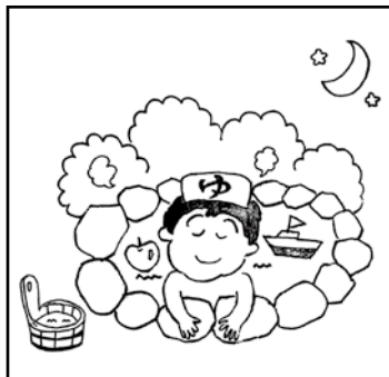
※タッチの違いや色の濃淡はまがいがしに含みません。