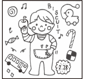
*タッチの違いや色の濃淡はまちがいに含まれません。