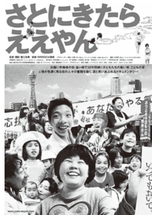
監督：重江良樹／2015年／日本／1時間40分

時 2月4日(日)9時半開場・10時上映 場 柳沢公民館 ※田無公民館ではありません。ご注意ください。 対 18歳以上の市内在住・在勤・在学者 定 50人(申込順) 申 1月9日(火)10時から電話で田無公民館へ