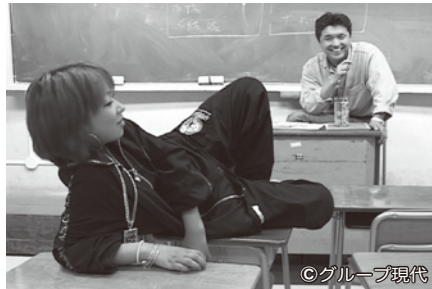
監督：太田直子／2010年／日本／1時間55分

定時制高校をご存じですか？ 夜の教室は学びのエッセンスであふれています。監督のお話も伺います。ぜひ、ご参加ください。 時 1月21日(日) 開場：13時 映画：13時半～15時半 監督トーク：15時40分～16時半 場 ひばりが丘公民館 対 市内在住・在勤・在学者優先 定 50人(申込多数の場合は抽選) 講 太田直子(映画監督) 申 1月12日(金)12時までに電話かメールでひばりが丘公民館へ