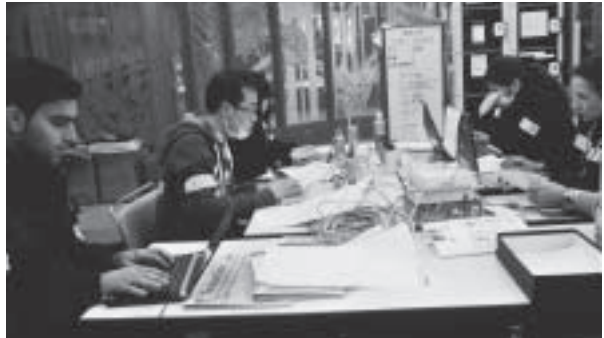
東日本大震災での翻訳活動写真① 災害多言語支援センターでボランティアスタッフが翻訳活動に取り組む様子

そこで、仙台市では外国人被災者を支援するために、「災害多言語支援センター」を設置し、仙台国際交流協会が運営をしました。外国人被災者が必要だと思われる情報を英語、中国語、韓国語、「やさしい日本語」に翻訳し、インターネット、ラジオ、