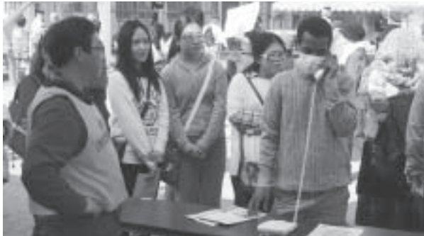
外国人住民との防災訓練 外国人参加者が緊急通報訓練に挑戦!