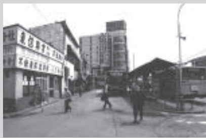
西武新宿線田無駅北口ロータリー 平成2(1990)年撮影

旧田無市では、昭和45(1970)年から調査を実施、昭和49年12月に事業決定し、田無駅北口再開発事業を進めました。平成7(1995)年3月10日には再開発ビル(アスタ)がオープンし、その1年後の平成8年3月8日から田無駅北口駅前交通広場の利用が始まりました。