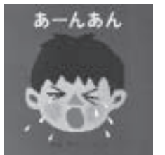
『あーんあーん』 せな けいこ作・絵 福音館書店刊