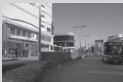
現在の田無駅北口駅前交通広場