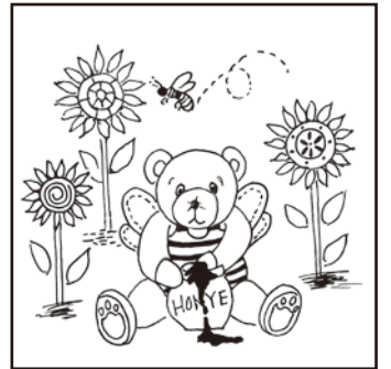
※タッチの違いや色の濃淡はまちがいに含まれません。