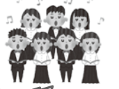
記念歌は、12月開催の30周年記念イベントで発表します。