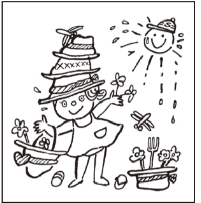
※タッチの違いや色の濃淡はまちがいに含まれません。