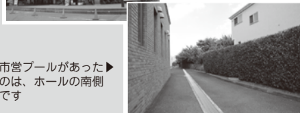
市営プールがあったのは、ホールの南側です