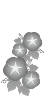
*金額の記載がないものは無料です。

告、答申起草委員会の進捗状況の審議、事業計画書・報告書の審議 ほか 合築複合化基本プラン策定のための検討部会が設置され、基本プラン策定に向けて検討がされているとの行政報告がありました。 公運審答申起草委員会は、11月末の答申に向けた予定表を提示。答申策定のため、公民館主催事業のイメージを公運審委員にも求めました。 議会にて「3館合築」「公民館運営体制の在り方の議論」などが取り上げられた旨の報告がありました。3館合築の検討部会の動きだけでなく、公民館にかか