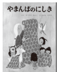
「やまんばのにしき」 (松谷みよ子文・瀬川康男絵、ポプラ社刊)

なぜ21日なのか? 餅? 70代の友人から話を聞いた。「お産の後3週間は水仕事などせず、たっぷり母乳を出すために餅、うどん、鯉こくなどを食べるように言われた。そして実家の母は実際そのような世話をしてくれただわ。そうなのだ! 山姥は産後の休養を取りたかったのだ。大人になってから読むと、山姥のおおらかで温かな母性が伝わってきた。あかざはんばの、村を救おうとする心意気、お礼にももらった錦を惜しげなく村人にやる気前のよさにも女性の頼もしさを感じた。