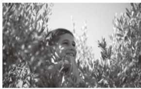
パレスチナにて