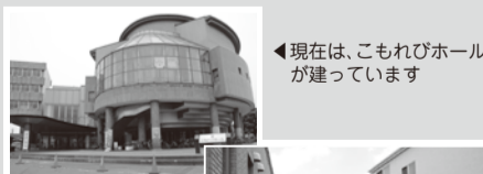
◀現在は、こもれびホールが建っています