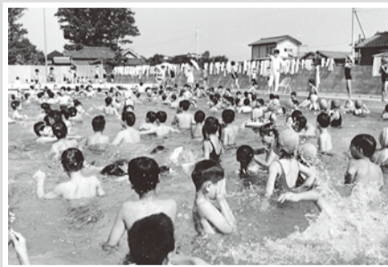
保谷市営プール・昭和44(1969)年撮影

昭和44(1969)年1月、旧保谷市役所(現保谷庁舎)の敷地内に市営プールが完成し、同年7月10日に開場しました。大プール(縦25m、横11m、深さ1.3m)と幼児プール(縦10m、横8m、深さ0.4m)があり、スポーツセンターがオープンした平成5(1993)年まで毎年7・8月に開放されていました。