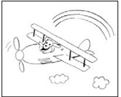
※タッチの違いや色の濃淡はましがしに含みません