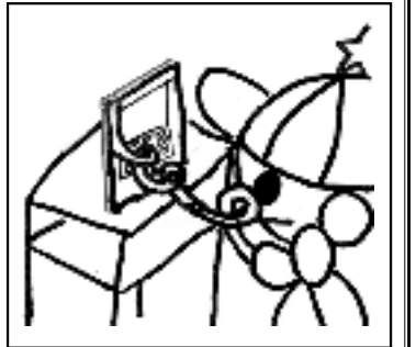
※タッチの違いや色の濃淡はまちがいに含まれません