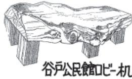
谷戸公民館ロボット机

時 3月15日(日)14時～16時 場 谷戸公民館 対 本事業に興味関心がある方 定 50人