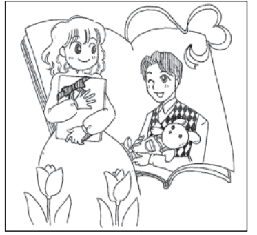
記念日にちなみまちがいがし探し絵をお楽しみください。まちがいはらう。解答は2面下。