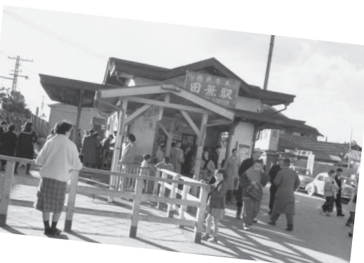
▲昭和34年西武電鉄田無駅