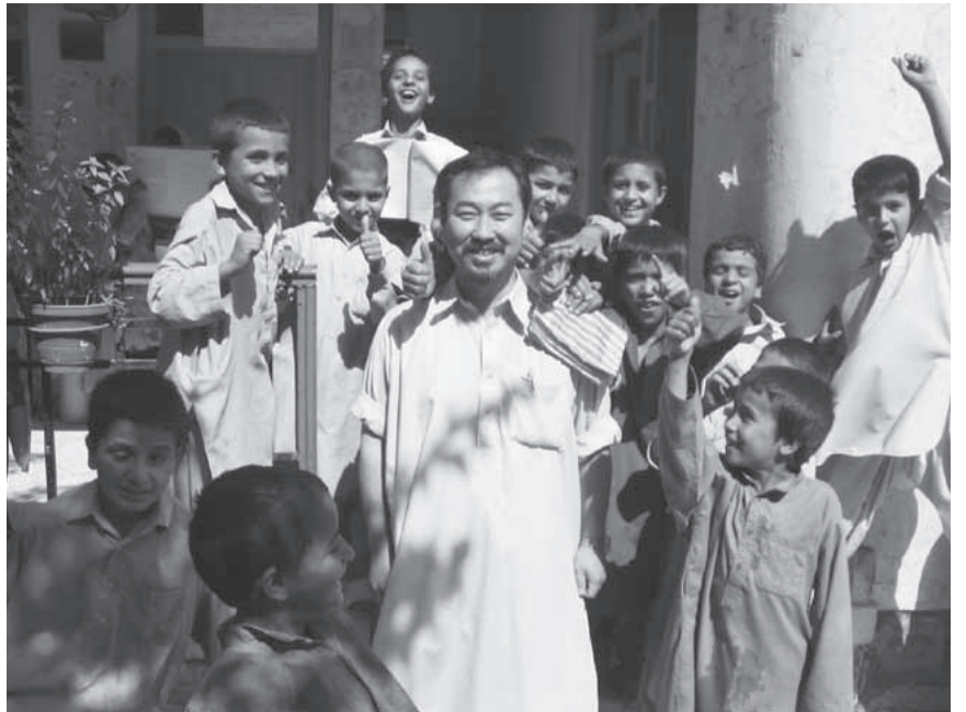
コミュニティ文庫取材・アフガンの子どもたち